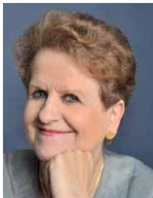
Claire BRISSET Journaliste, Ancienne porte-parole de l'UNICEF, Ancienne Défenseure des Enfants Inspectrice générale honoraire de l'Éducation nationale